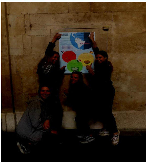
Las creadoras del póster